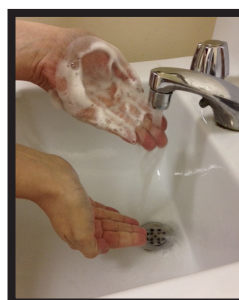
Passo 4: Enxaguar as mãos em água corrente.