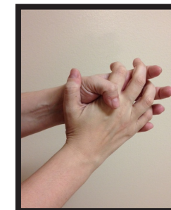
Passo 3: Esfregar as mãos pelo menos 15 segundos ou até secar.