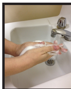
Fase 3: lavare entrambi i lati delle mani e tra le dita.