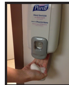
Fase 1: applicare il gel o la schiuma sulle mani.