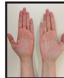
una volta asciutte, le mani sono

Per prevenire secchezza, irritazione e screpolature che si verificano quando gli oli naturali della pelle vengono eliminati con una pulizia ripetuta: