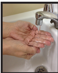
Fase 1: bagnarsi le mani con acqua