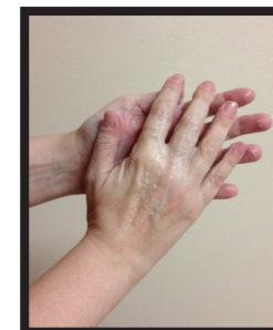
Fase 2: diffondere su entrambi i lati e tra le dita delle mani.